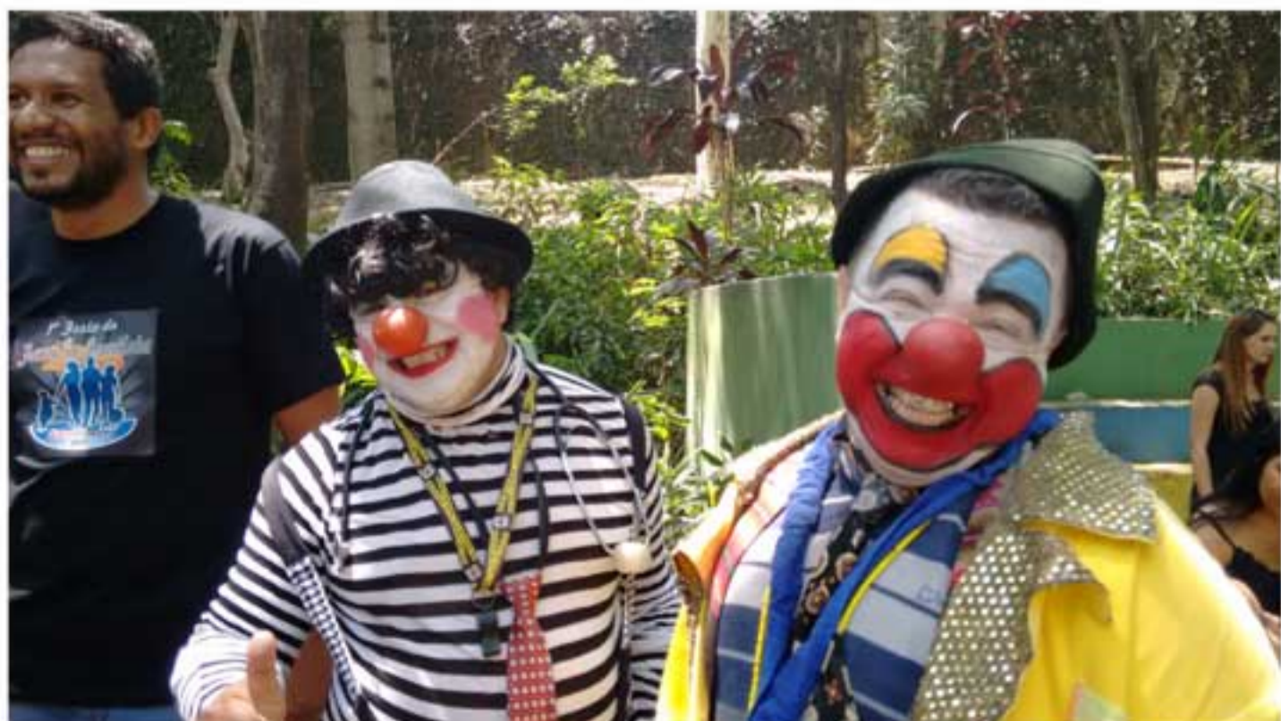
A confraternização da família frentista com a alegria do dia das crianças