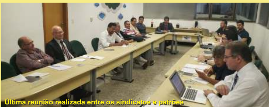
Última reunião realizada entre os sindicatos e patrões

Devemos dizer que esta ganância não se justifica. Os trabalhadores não ativos, sobre os quais os patrões não querem pagar PLR, só teriam direito proporcional aos meses trabalhados. Agora, seria um crime demitir um trabalhador em novembro e declarar que ele não tem direito à PLR! Isto é um escândalo! Deve-se lembrar que o patrão paga a PLR pelo tempo efetivamente trabalhado no ano. Desta