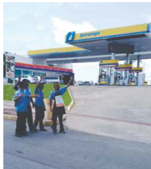
Sindicato flagra trabalhadores chamando consumidores

O Sindicato vem recebendo denúncias de mais um absurdo cometido por alguns postos de combustíveis, que representa verdadeiro assédio moral sobre os trabalhadores. Vários companheiros estão sendo obrigados a ficarem no meio da rua, no sol, tentando captar consumidores para abastecimento de combustível e demais serviços, atividade que rigorosamente não faz parte do contrato de trabalho.