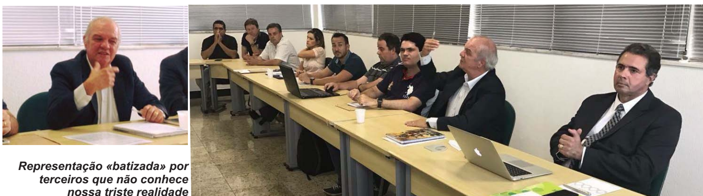
Representação «batizada» por terceiros que não conhece nossa triste realidade

D epois de atrasarem absurdamente as negociações da Convenção Coletiva em cerca de 50 dias, os patrões compareceram na reunião do último dia 26 de janeiro com as mãos vazias e com uma postura ainda mais desrespeitosa com os trabalhadores. A patrãozada não apresentou qualquer resposta às contrapropostas dos sindicatos para chegarmos a um acordo, apesar de passados três meses de nossa data-base de 1º de novembro do ano passado.